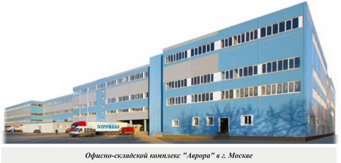
Офисно-складской комплекс "Аврора" в г. Москве