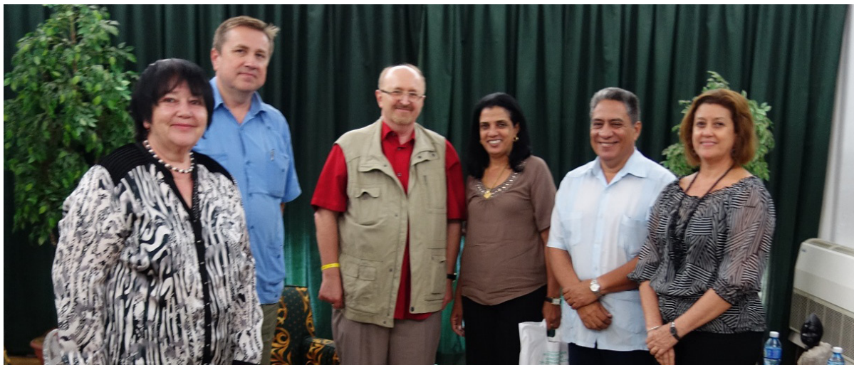
Встреча в Министерстве внешней торговли и иностранных инвестиций Кубы г. Гавана, 6 мая 2016 г.

Пресс-центр ОО "Минский столичный союз предпринимателей и работодателей"