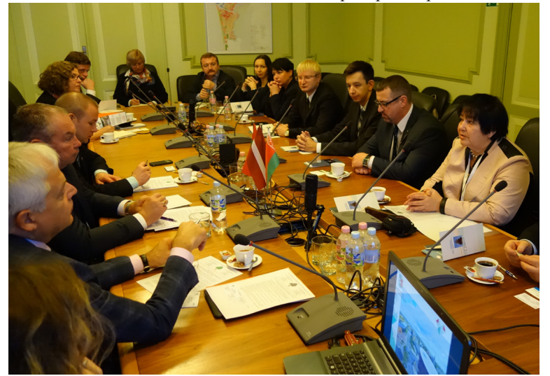
Встреча в Городской Думе г. Лиепая с членами делегации Республиканской конфедерации предпринимательства и Минского столичного союза предпринимателей и работодателей. 12 ноября 2015 года.

В ходе визита, поддерживаемого Лиепайской городской