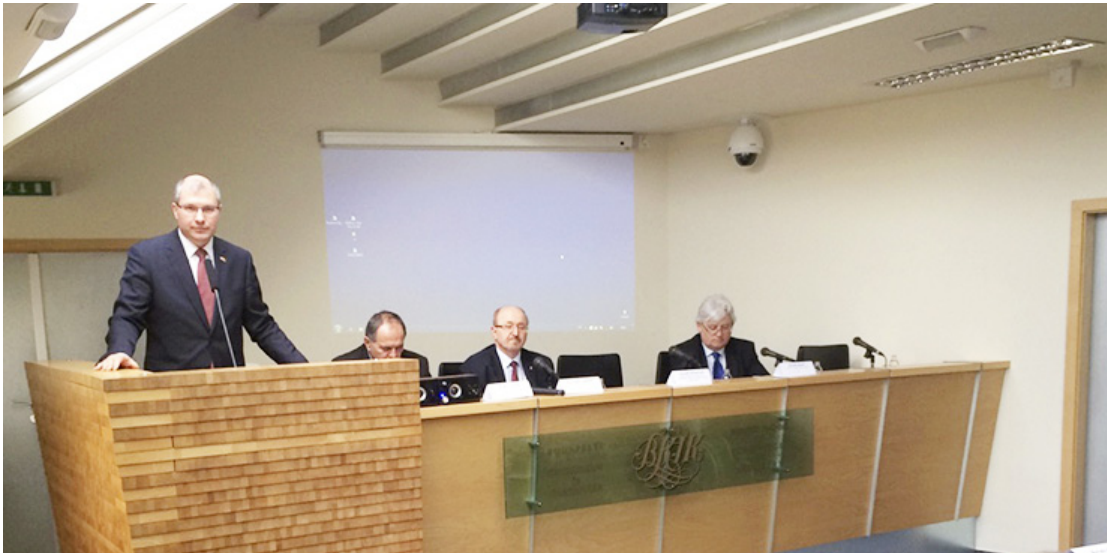
Участников Дня белорусского предпринимательства приветствует Чрезвычайный и Полномочный Посол Республики Беларусь в Венгрии Эдуард Хайновский.